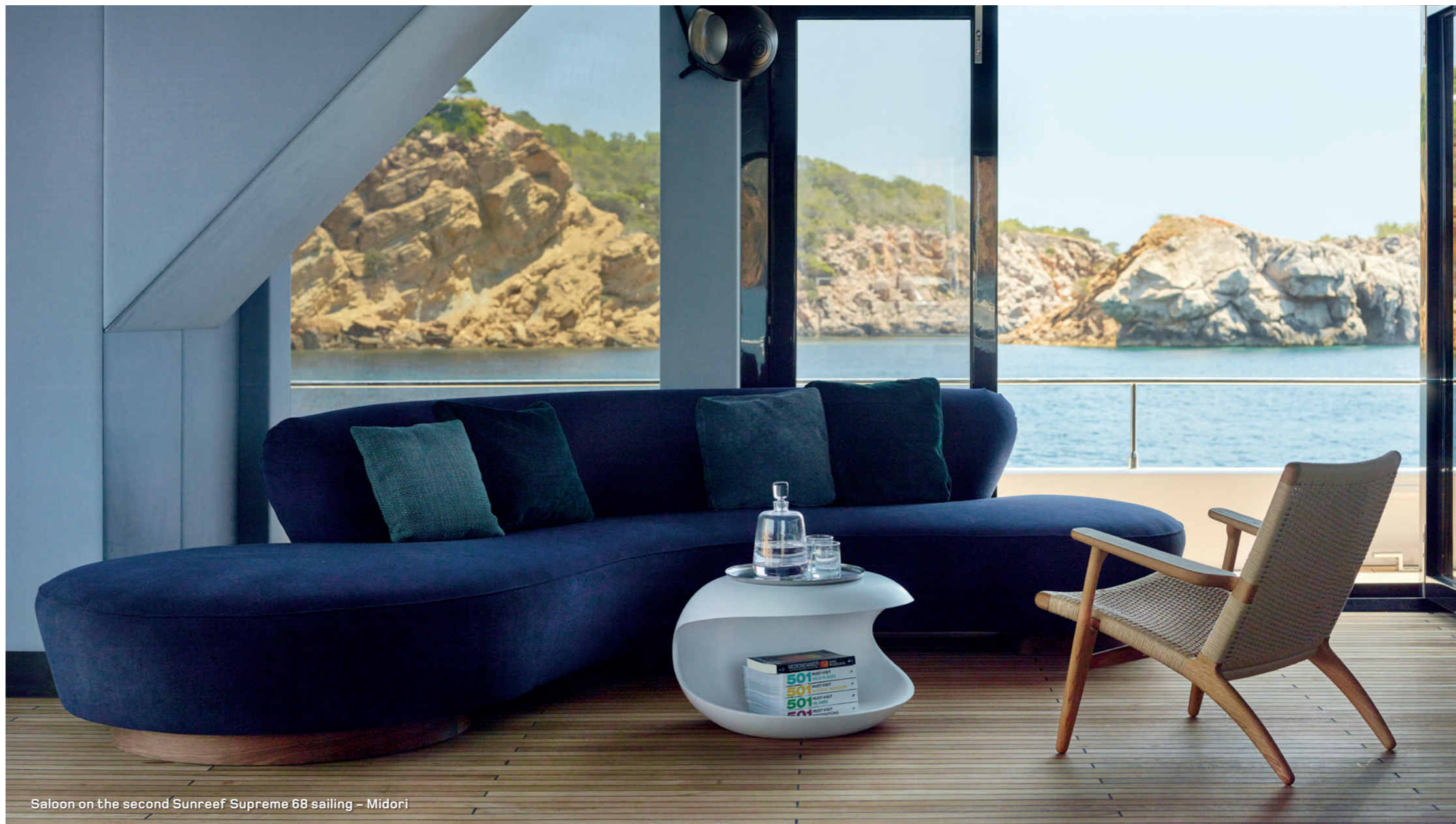
Saloon on the second Sunreef Supreme 68 sailing - Midori