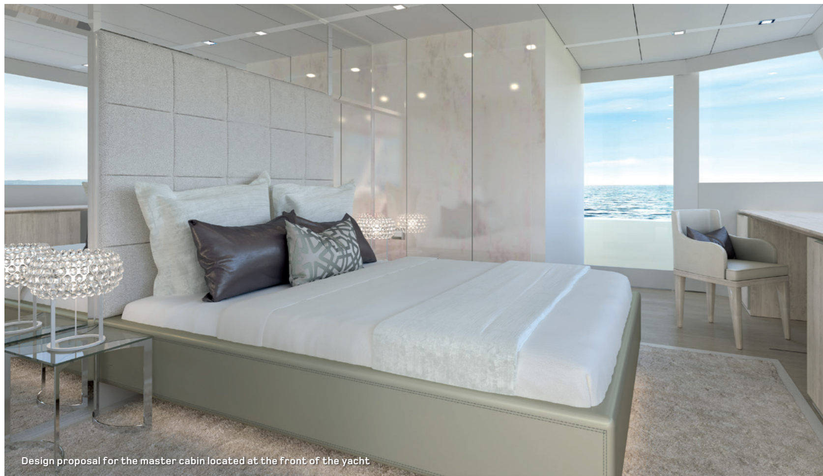
Design proposal for the master cabin located at the front of the yacht