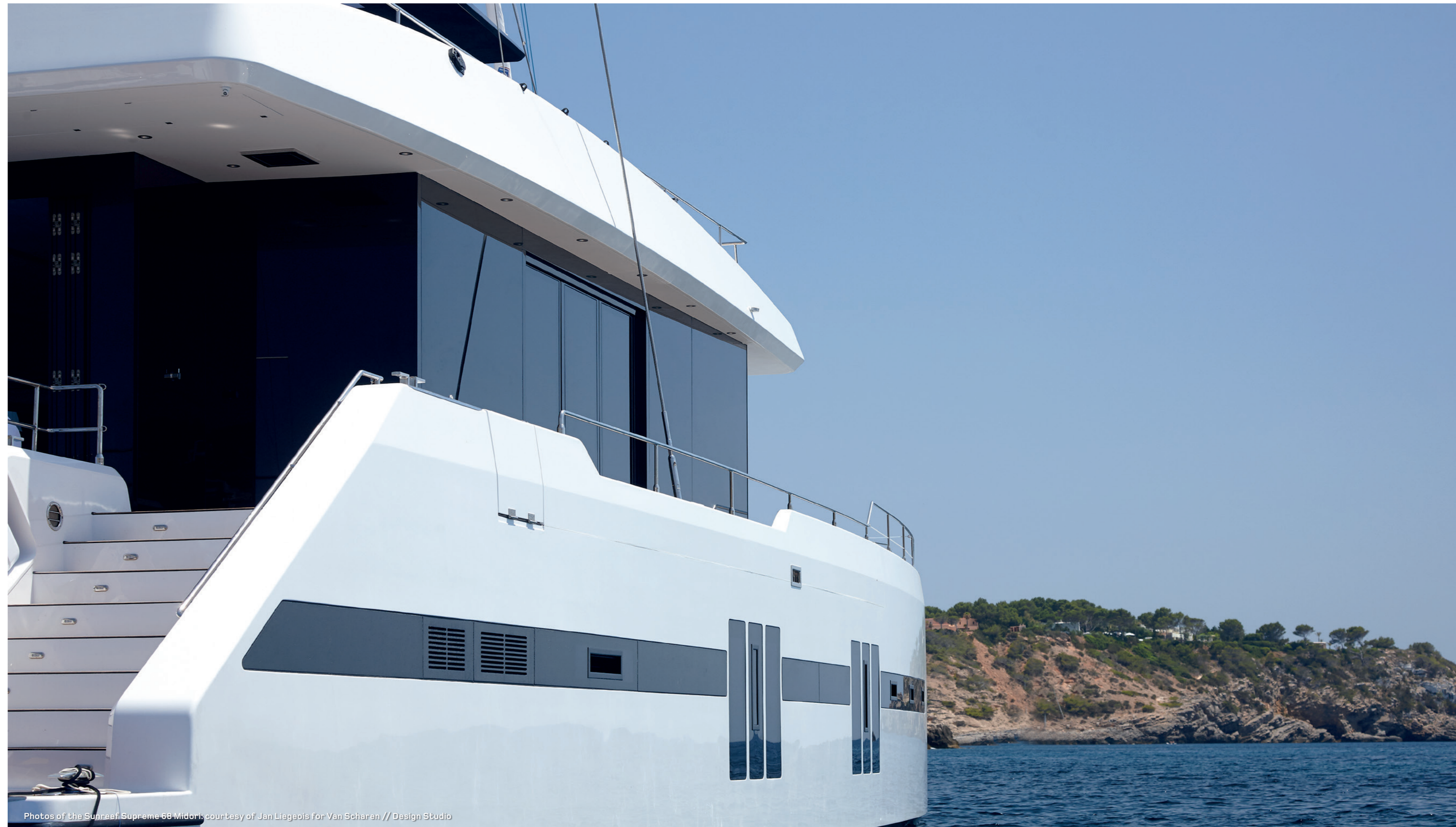
Photos of the Sunreef Supreme 68 Midori

Le Sunreef Supreme 68 est un catamaran de 68 pieds avec un espace habitable total de près de 300m 2 , offrant la surface d'un superyacht sur un yacht de moins de 24m. Les versions voile et moteur de ce modèle offrent d'excellentes performances et des technologies avant-gardistes.