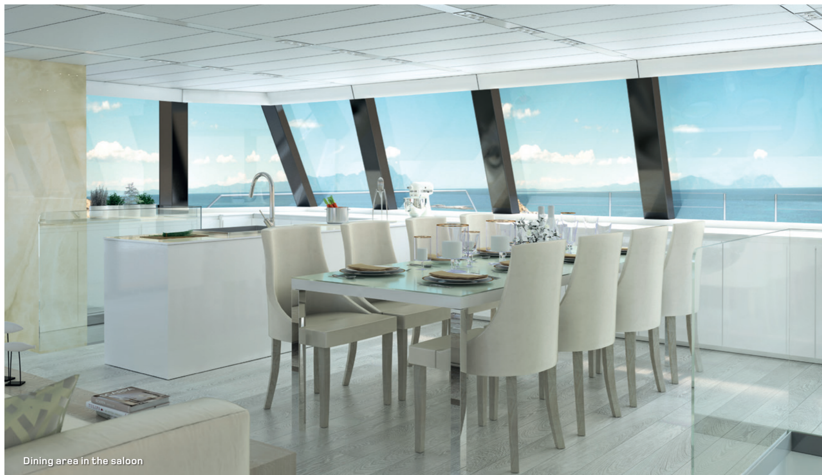
Dining area in the saloon