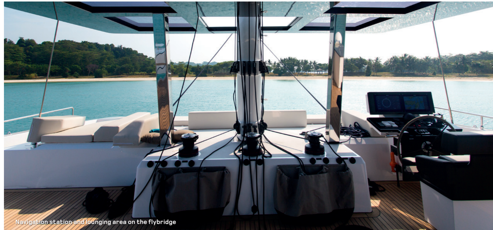
Navigation station and lounging area on the flybridge

L'originalité du concept Sunreef Supreme 68 permet de doter le yacht d'un immense flybridge recouvert d'un élégant bimini. Ce vaste espace de 65m 2 peut être équipé d'un bar avec barbecue et des larges sofas. La terrasse avant du yacht est l'espace de détente idéal grâce à ses généreux bains de soleil et son Jacuzzi.