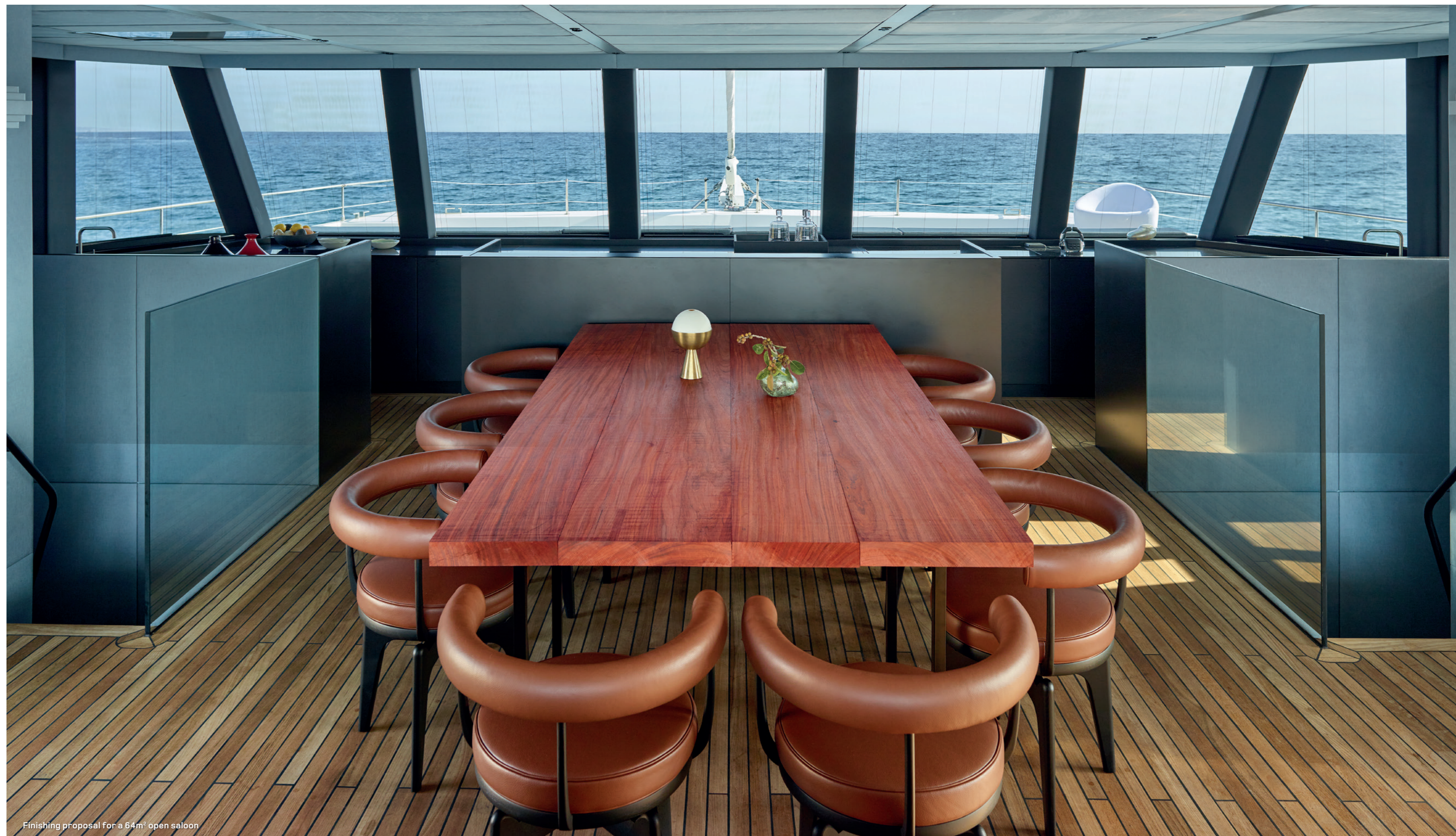
Finishing proposal for a 64m 2 open saloon

Le mât du Sunreef Supreme à voiles est fixé au niveau du flybridge sur une poutre carbone - un système innovant pour garder un salon complètement dégagé.