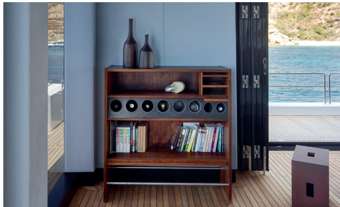
Cabin on board Midori