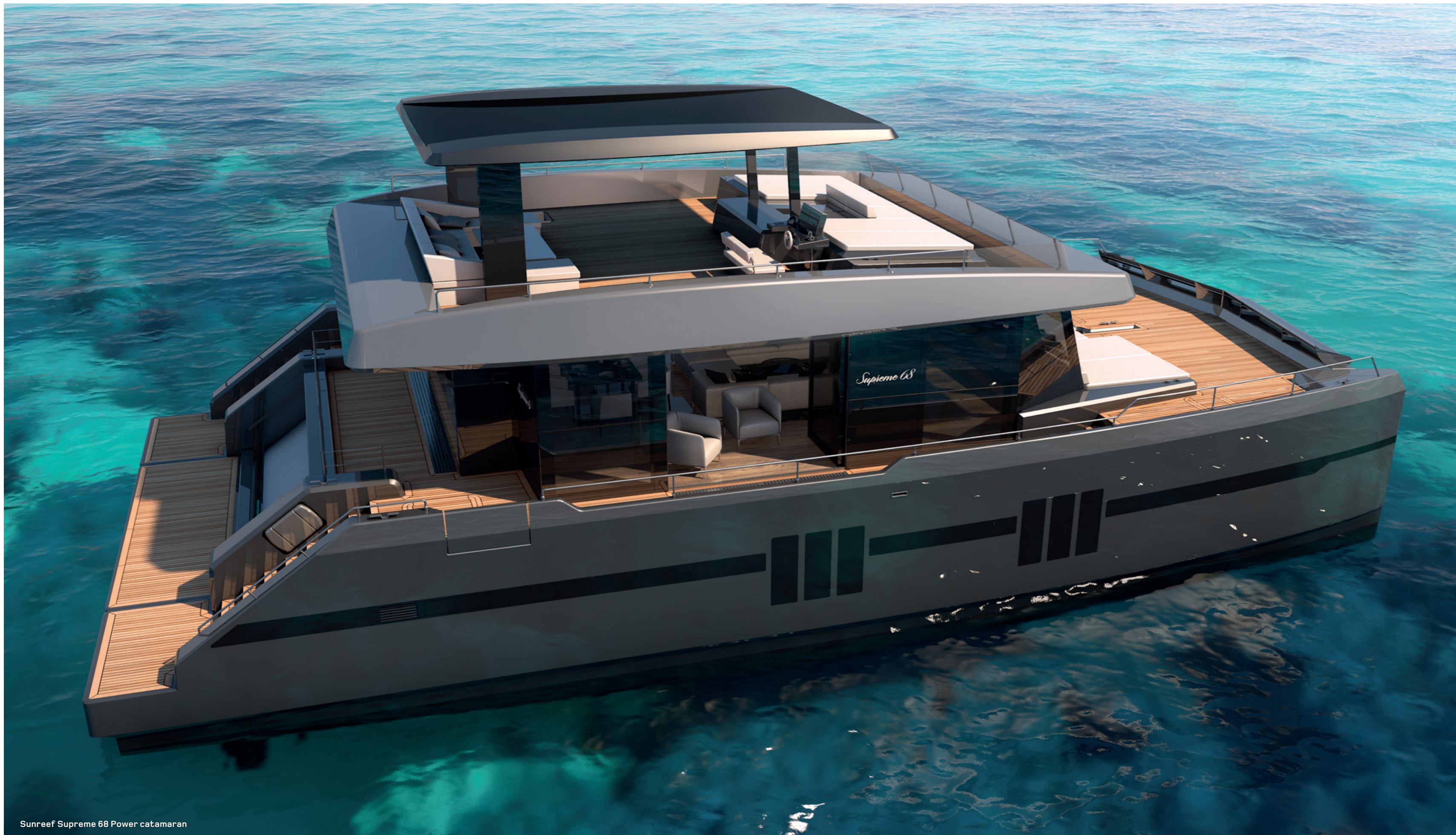
Sunreef Supreme 68 Power catamaran

The Sunreef Supreme 68 Power offers numerous reliable engine options for an optimized cruising performance. The yacht can be equipped with IPS propulsion to maximize and facilitate her manoeuvrability.