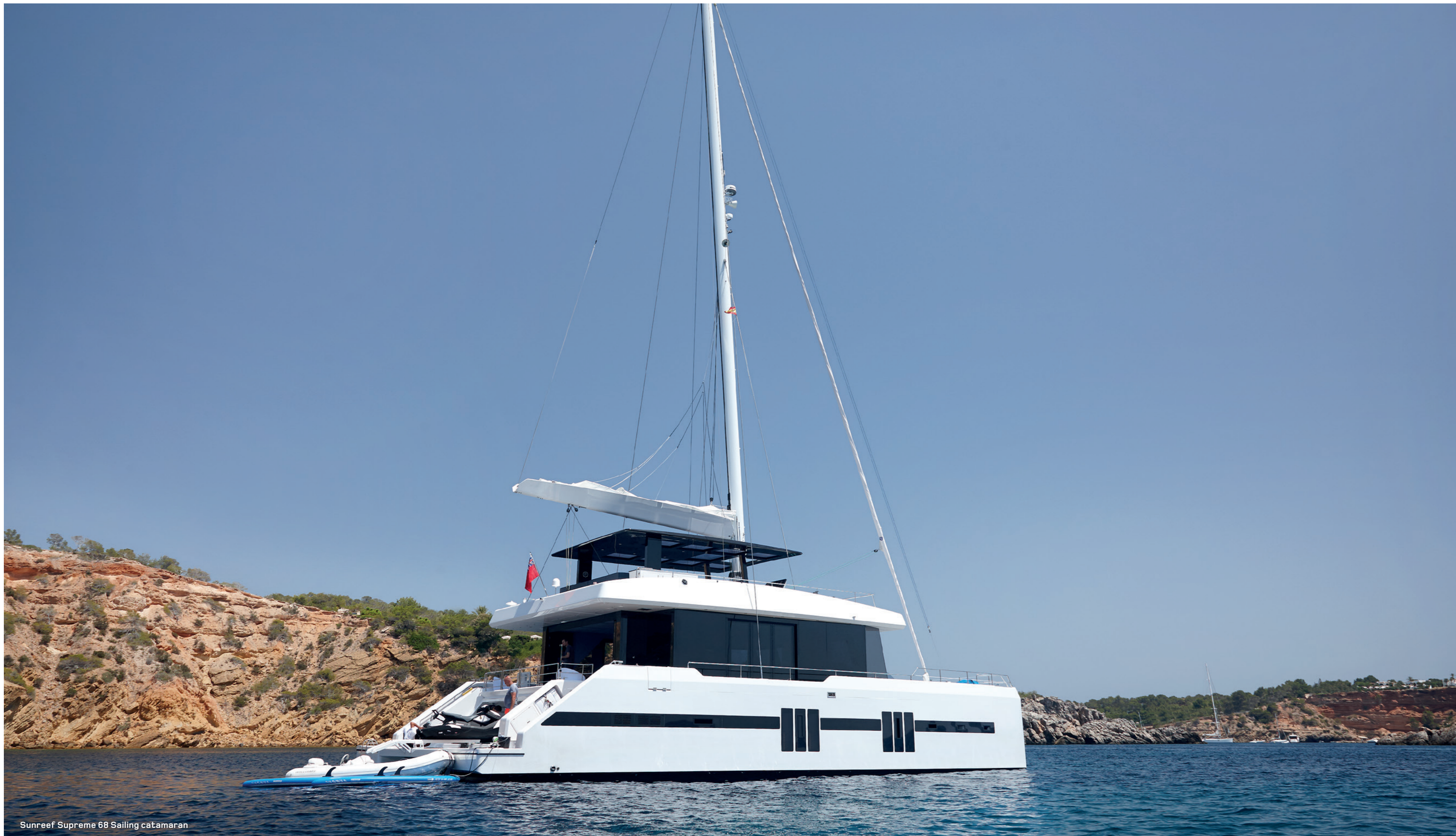
Sunreef Supreme 68 Sailing catamaran

The architecture of the Sunreef Supreme revisits the way catamarans have been so far designed. A new, radical concept of the superstructure allows to keep the saloon and exterior deck on the same level. As a result, the Sunreef Supreme 68 boasts a massive main room surrounded with floor to ceiling glass – a smooth, seamless space opening wide onto the cockpit and giving direct access to the deck through folding doors on both sides of the yacht. The exterior and interior surfaces of the boat merge into one lounging and dining area with a panoramic view.