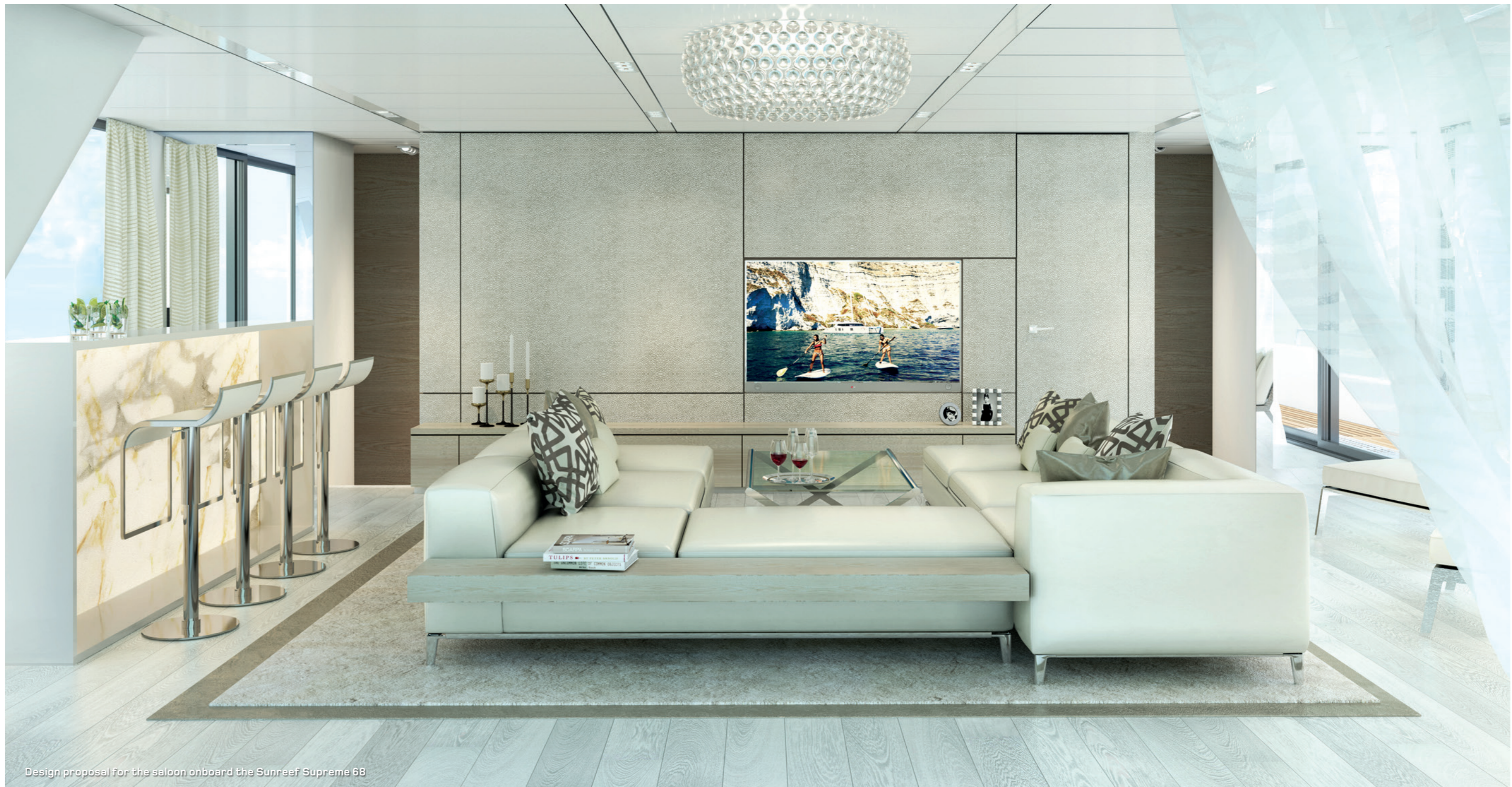
Design proposal for the saloon onboard the Sunreef Supreme 68

The front part of the scenic main room, depending on the Owner's choice, can feature an extravagant master suite with a view to the sea and a private dressing room or up to two vip cabins. The arrangement choice for the volume available amidships and on the sides is limitless with enough breadth to house a fully equipped galley, a long dining table, large sofas, a bar, coffee tables and lounging areas.