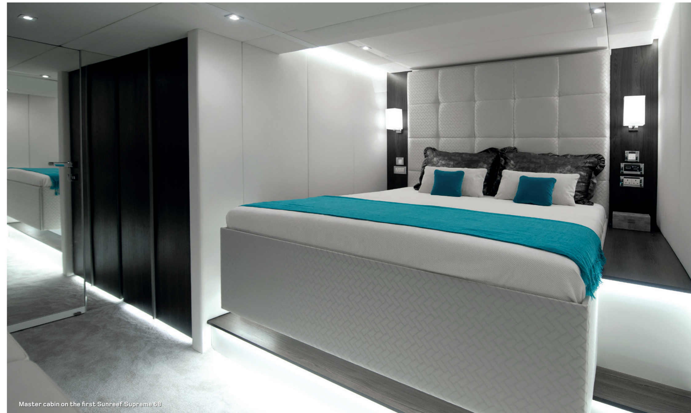
Master cabin on the first Sunreef Supreme 68

The design of the hulls offers a maximum versatility in the possibilities for a smart, individually tailored layout. The impressive volumes available can accommodate a large galley with a pantry, a generous master suite with a dressing space, luxuriously furnished guest cabins and crew quarters. The ample forepeaks of the Sunreef Supreme 68 can be used to install a crew cabin and bathroom or serve as voluminous storage space.