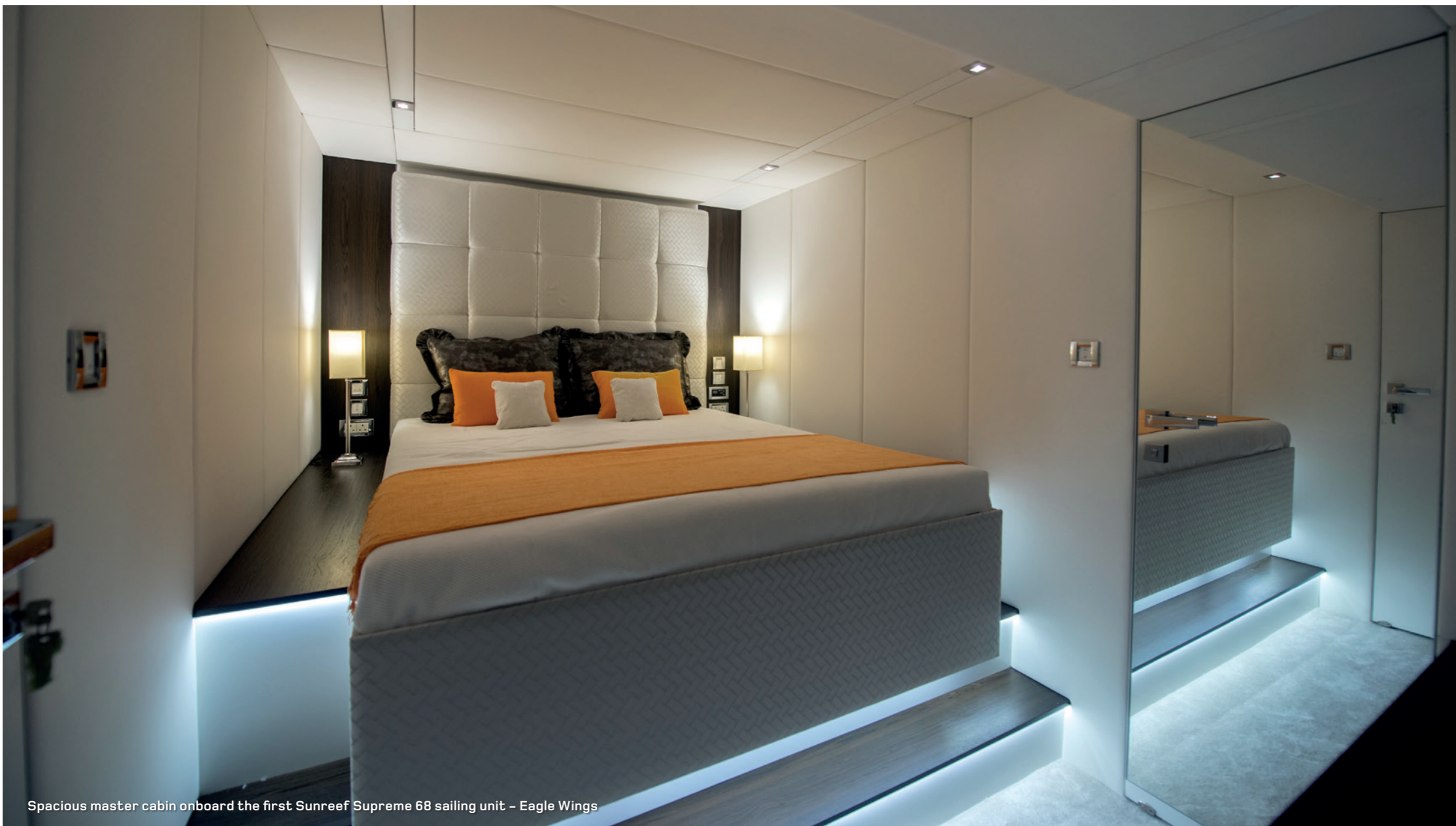
Spacious master cabin onboard the first Sunreef Supreme 68 sailing unit - Eagle Wings