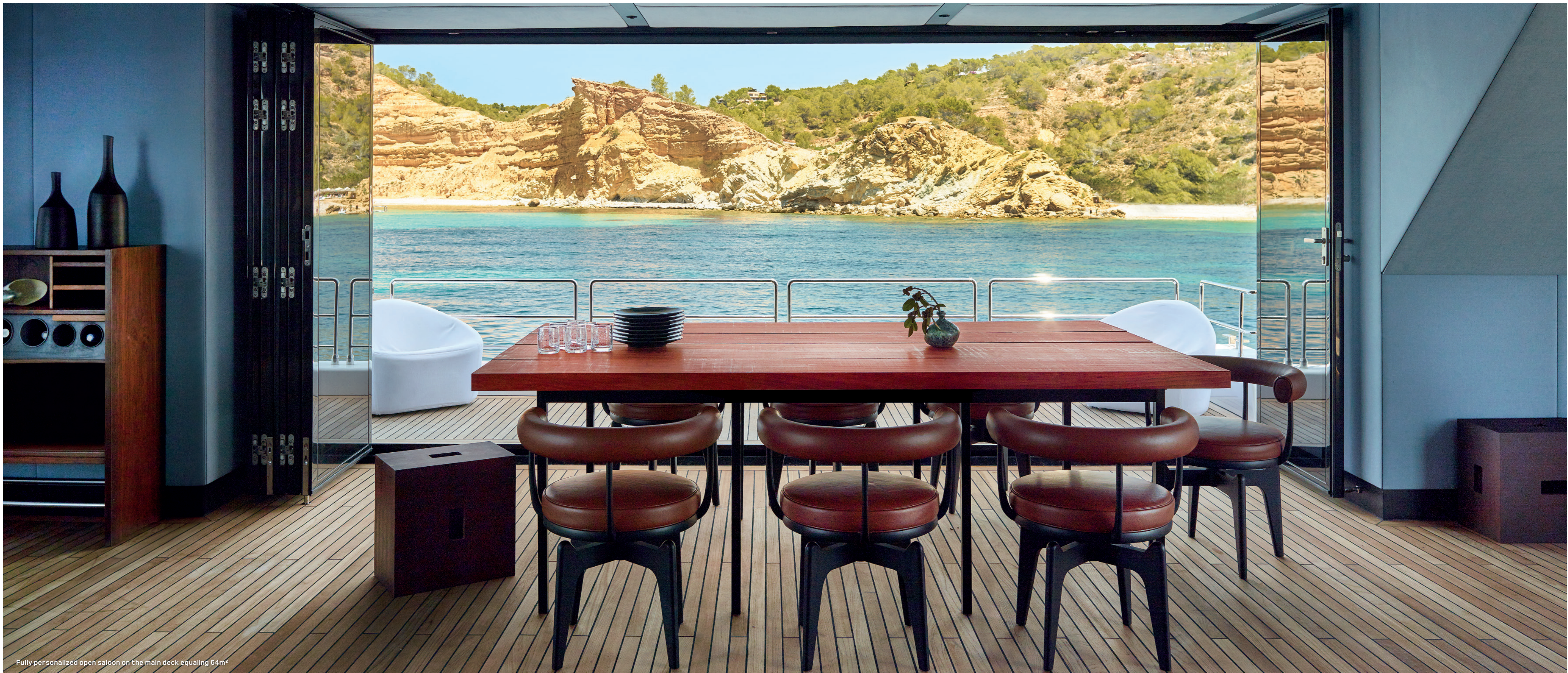
Fully personalized open saloon on the main deck equaling 64m 2