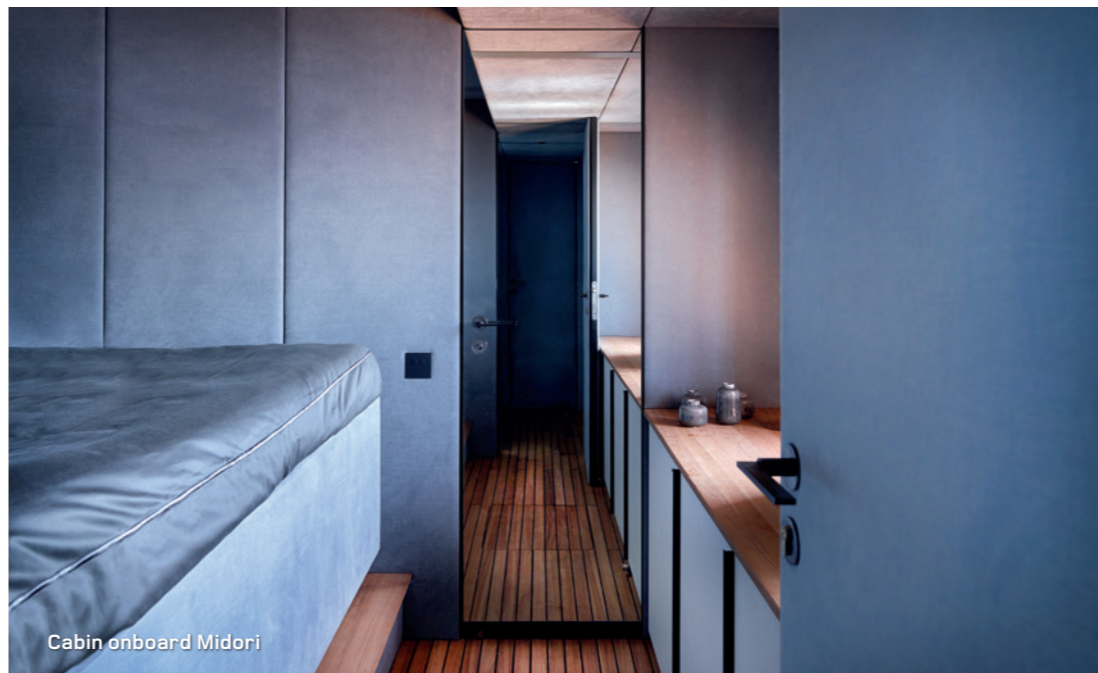
Cabin on board Midori