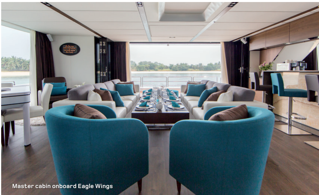
Master cabin on board Eagle Wings