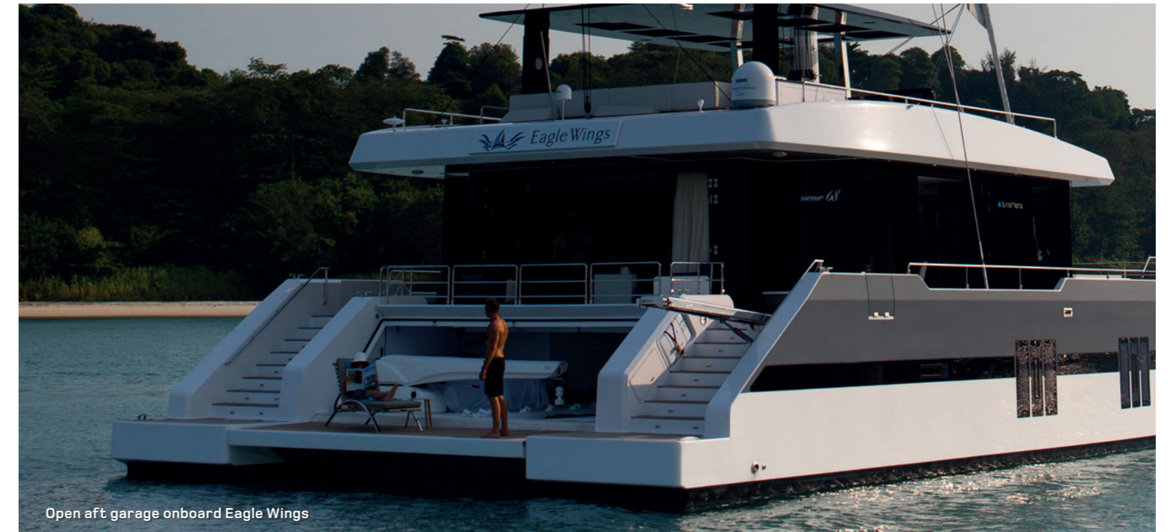
Open aft garage onboard Eagle Wings

Le Sunreef Supreme 68 est doté d'un garage arrière - une solution technique révolutionnaire sur un catamaran de moins de 70 pieds. Cet espace permet de ranger une annexe de 5m, deux jet-skis, l'équipement de plongée et les jouets nautiques. La porte du garage en position basse, permet de créer une plateforme proche de l'eau, idéale pour les sports nautiques.